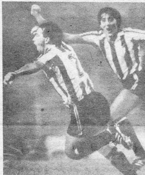
Jubelnder Gomez von Atletico Bilbao nach dem 2:0 gegen den 1. FC Magdeburg. Hat er damit bereits eine Vorentscheidung herbeigeführt? In der Szene daneben versucht Brandenburgs Schlussmann Zimmer den von Healy getretenen Strafstoßball im Flug zu parieren. Aber er war zu scharf und plazierte.

Der BFC sollte auch sie ernsthaft mit ins Kalkül einbeziehen! K. T.